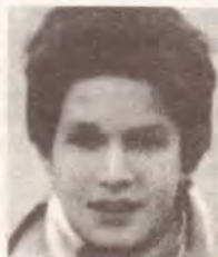
Йорг ФИШЕР, ФРГ

2000 год? Ну ладно. Итак, 2000 год. Насквозь отравленный воздух, очень-очень много безработных. Нет рыб в загрязненных реках. Нет старых жилых домов. Их заменили стозэтажные бетонные дома с атомными бомбоубежищами. Машины похожи на ящики на колесах с электрическим двигателем. Полным-полно атомных электростанций. Демократии нет, политики правят без народа. Исчезли деревья. Долина Амазонки превратилась в пустыню. Зверей можно увидеть только в зоопарках. Пищу готовят в микроволновых печках, но в основном она в